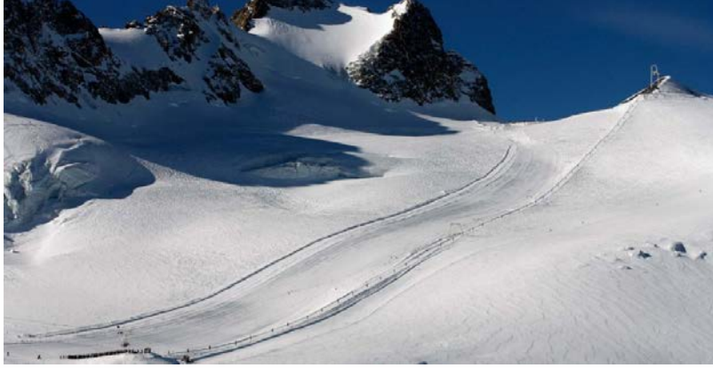
L'actuel télési sur le glacier de la Girose