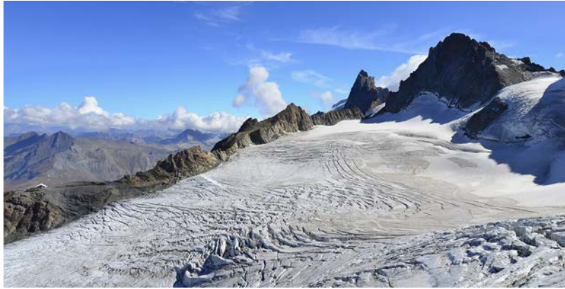
Vue depuis la future gare d'arrivée du téléphérique